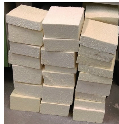
Fot. 1. Pocięte próbki PUR o grubości 7 – 16 cm

stym próbki o wymiarach 20 x 20 cm oraz zróżnicowanej grubości 16, 14,5, 14, 13,5, 13, 12,5, 12, 10,5, 9,5, 9, 8,5, 8, 7,5 i 7 cm (fotografia 1).