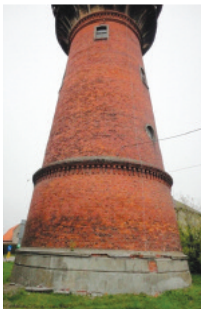
Fot. 1. Murowany trzon wieży ciśnień Photo 1. The core of brick water tower

Murowana konstrukcja wieży ciśnień wymaga jedynie prac konserwacyjnych i zabezpieczających przed dalszym niszczeniem. Jednym z najgorzej zachowanych elementów budowli jest konstrukcja wsporcza betonowej obudowy zbiornika, gdyż kapinos uległ niemalże kompletnej degradacji (fotografia 2). Na całym obwodzie widoczne są odspojone kawałki betonu, które można wyjąć ręką, co stanowi ogromne zagrożenie dla ludzi poruszających się wokół wieży. Uszkodzenia w warstwie betonu odsłoniły stalową konstrukcję z kątowników, a jedno z ramion kątownika strawiła doszczętnie korozja. W konstrukcji stropu nie ma widocznych rys czy ubytków. Jedynie belki stropu podobnie jak klatka schodowa noszą ślady powierzchniowej korozji, dlatego należy podjąć działania, które zapobiegną dalszej degradacji (fotografia 2). Zbiornik jest w dobrym stanie technicznym, ale sama obudowa nie nadaje się do dalszej eksploatacji. Stan techniczny dachu i reszty elementów powyżej trzonu murowanego jest zły, a brak opierzenia i systemu odprowadzenia wody powoduje niszczenie betonu.