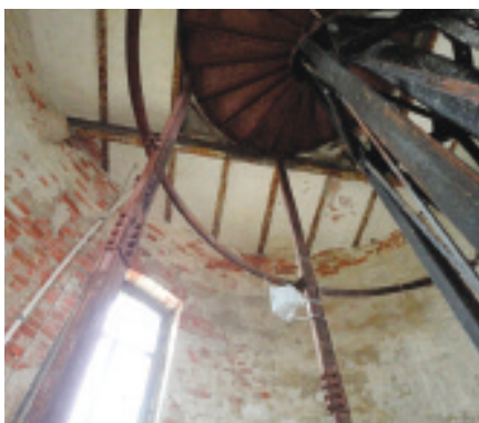
Fot. 2. Widok muru, stropu i konstrukcji klatki schodowej

Photo 2. View of the brick wall, ceiling and construction of staircase