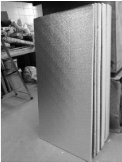
Płyty warstwowe z rdzeniem z pianki poliuretanowej w okładzinach aluminiowych Photo 1. Sandwich panels with a polyurethane foam in aluminum lining