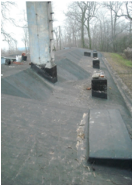
Zdjęcie 2 : Dach po naprawą – pokryty EPDM'em