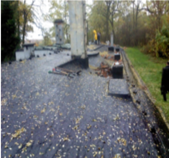
Zdjęcie 1 : Dach przed naprawą – pokryty papą i smołą