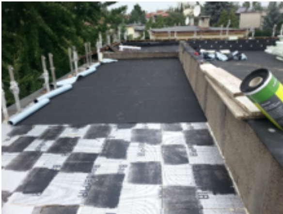
Zdjęcie 3 :Zastosowanie płyty PIR z osnową aluminiową firmy Bauder

wersjach ) lub membrany zgrzewalnej samoprzylepnej firmy CARLISLE Resitrix SK lub SKW, jedynie styropian EPS laminowany papą nadaje się do cało powierzchniowego łączenia z hydroizolacją. Połączenie termoizolacji z hydroizolacją na całej powierzchni wyklucza fałdowanie się izolacji czyli zahamowania wody a to daje możliwość stosowania takiego systemu przy niewielkich spadkach. Zastosowanie takiego systemu daje projektantom duże pole popisu do zagospodarowania dachu np. włączeniu dachu zielonego z tarasami w których można stosować deski tarasowe lub płytki tarasowe na dystansach jako trakcje komunikacyjne lub jako część użytkową. Dodatkowa zaleta stosowania płyt PIR to ich właściwości termoizolacyjne zwłaszcza przy zastosowaniu płyt z osnową aluminiową co umożliwia stosowanie mniejszych grubości, płyty te występują również w wersji pióro wpust, dzięki osnowie z aluminium zwiększa się wytrzymałość płyty co zapobiega wgniataniu się np. legarów podtrzymujących deski tarasowe lub podkładki pod płytki tarasowe. Płyty PIR mają dużą odporność na temperaturę. Przykładowe zastosowanie płyt PIR.